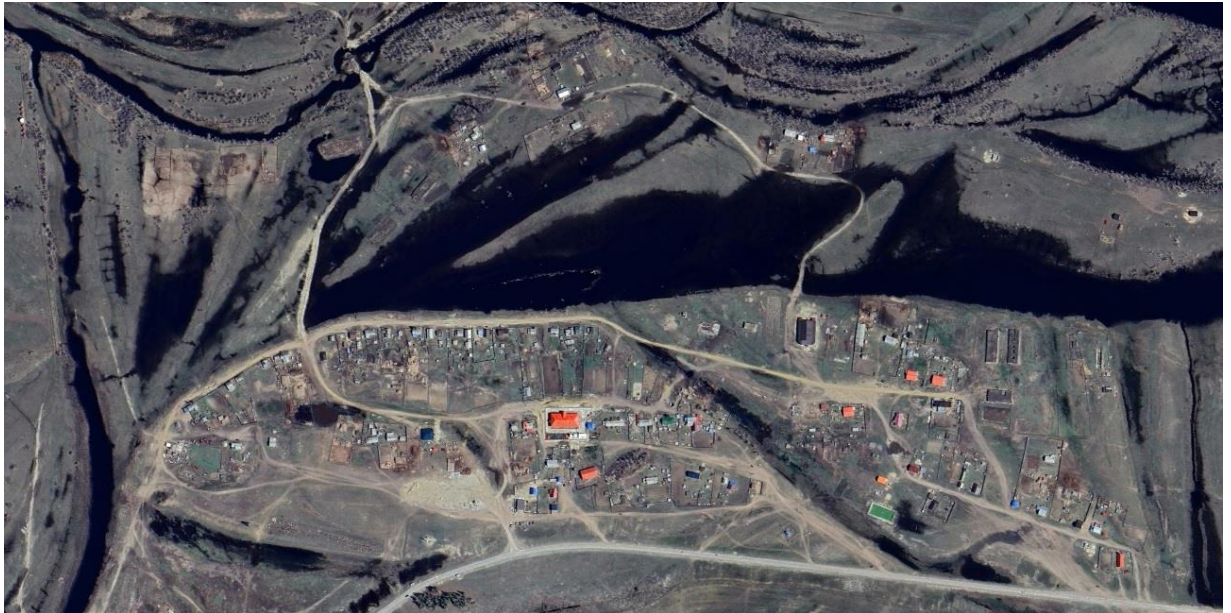
Рисунок 1. Спутниковый снимок села Кысыл-Деревня 2024 г.

расположенный в 8 километрах от улусного центра с. Намцы, административного центра района, и в 3 километрах от с. Аппаны, административного центра наслега (рисунок 1).