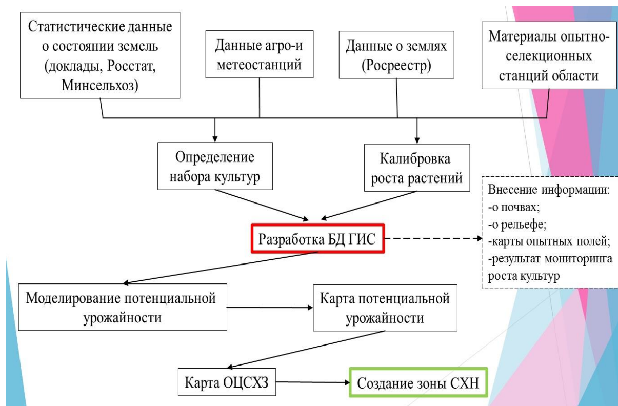
Рисунок 4. Последовательность мероприятий при реформировании сельскохозяйственных земель

После чего на основе информации, полученной с агрометеорологических станций, метеорологических и почвенных данных проводится калибровка имитационной модели роста растений.