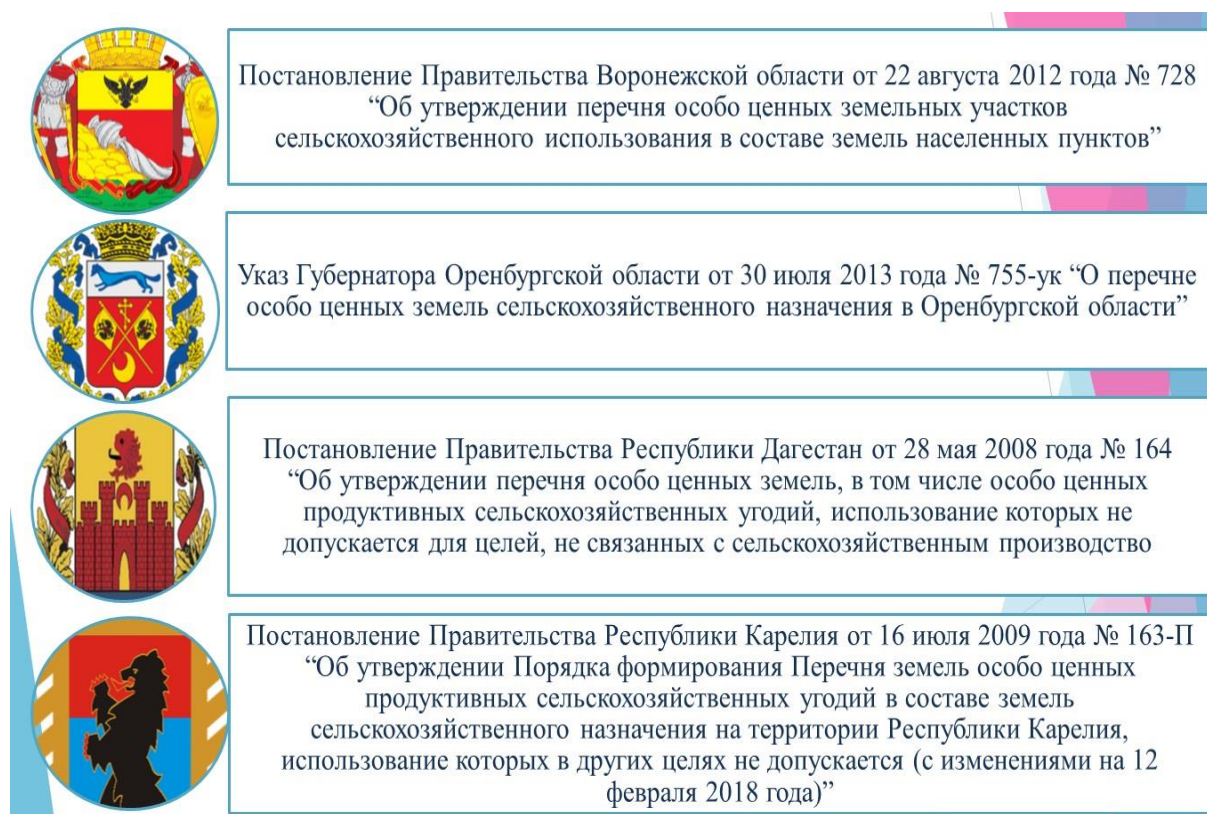
Рисунок 3. Субъекты, установившие правила в отношении установления особо ценных сельскохозяйственных земель

В России существует ряд подходов по выделению особо ценных сельскохозяйственных земель. Однако, оно должно производиться на уровне муниципального района. Уровень района оптимален, так как его система землепользования более устойчивая, однородная и целостная по сравнению с системами землепользования отдельных поселений.