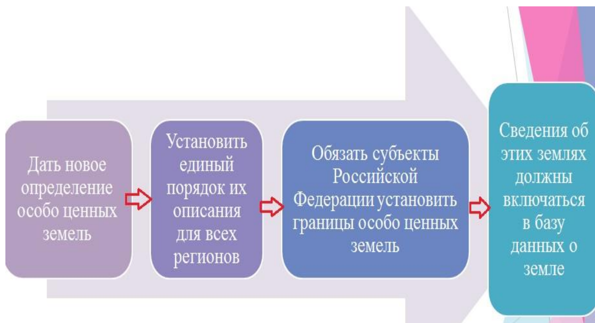
Рисунок 1. Задачи реализации законопроекта

На различных конференциях вопрос часто подлежит дискуссии и требует разрешения нескольких задач, представленных на рисунке 1.