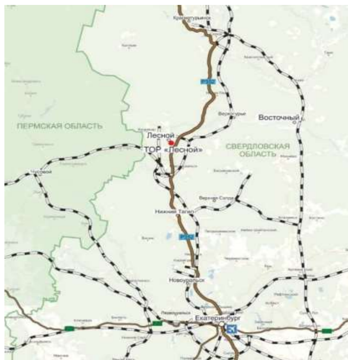
Рисунок 1 – ТОСЭР ГО «Город Лесной» [9]

Градообразующим предприятием в городе является комбинат «Электрохимприбор», который функционирует как многопрофильное предприятие, производя военную продукцию, стабильные изотопы, гражданские изделия, товары народного потребления, а также осуществляя реализацию нескольких конверсионных проектов.