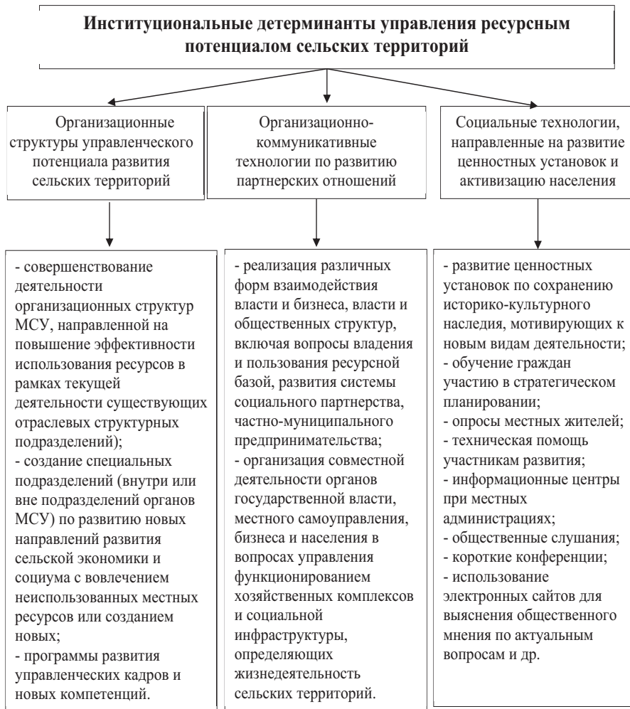
Рисунок 2. Институциональные детерминанты, определяющие эффективность управления ресурсным потенциалом сельских территорий Figure 2. Institutional determinants that determine the effectiveness of managing the resource potential of rural areas

Местное же население нуждается в наличии высокооплачиваемых рабочих мест, возможности получить комплекс качественных социальных услуг, включая услуги здравоохранения, образования, приобретения жилья и т.д. Поэтому необходимо создание таких институциональных условий развития сельской среды, которые бы не только удовлетворяли интересы всех социальных групп, но и обеспечивали бы единый вектор развития сельских территорий, совпадающий с целями государственной политики в области модернизации социально-экономической системы страны. Важно задействовать механизмы и инструменты управления ресурсным потенциалом, позволяющие совершенствовать организационные структуры, широко использовать организационно-коммуникативные технологии по развитию партнерских отношений, а также социальные технологии, способствующие взаимодействию различных субъектов общественных отношений, формированию ими собственных управленческих стратегий, развитию ценностных установок и активизации сельского населения. Реализация приоритетных детерминант в управлении ресурсным потенциалом села приведет к гармоничному развитию экономической, социальной, экологической и общественной сфер развития сельских территорий.