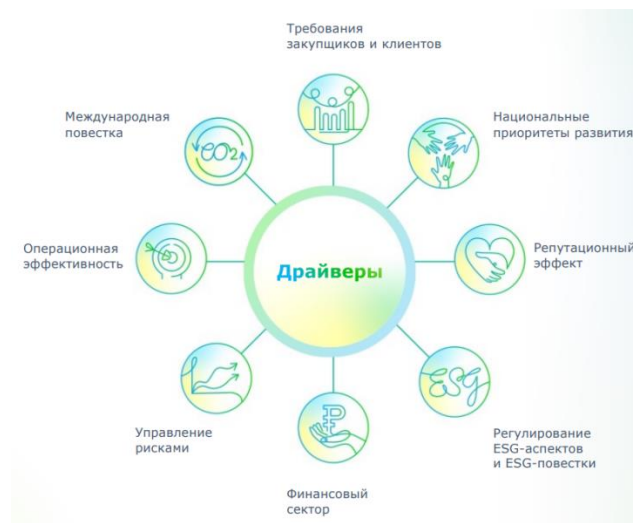
Рисунок 1. Драйверы ESG-повестки

Драйверы современной ESG-повестки показаны на рисунке 1.