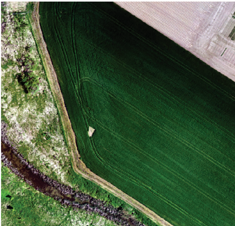
Рисунок 3. Фрагмент ортофотоплана, полученного по данным съемки с беспилотного летательного аппарата Phantom 4 Pro Figure 3. A fragment of an orthophotoplane obtained from the shooting data from the Phantom 4 Pro unmanned aerial vehicle

Указанная информация дает возможность в полном объеме оценить рациональное использование земельных массивов, рассчитать затраты на обработку конкретного массива, а также вычислить достоверно урожайность сельскохозяйственных культур. Крупномасштабная цифровая планово-картографическая основа, созданная на земли сельскохозяйственной организации с базой геоданных позволит наиболее оперативно внедрить элементы